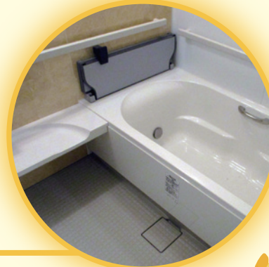
安心な特浴での入浴